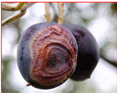
Oliva con sintomi di Lebba dell'olivo- areale Garda