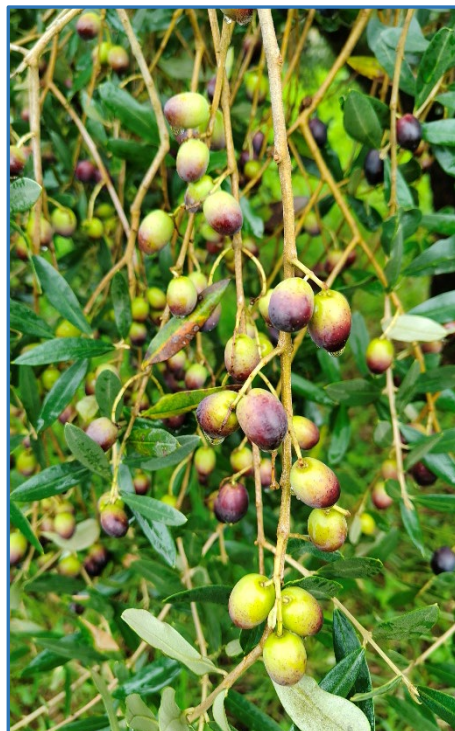
Fase fenologica Casaliva-Areale Garda