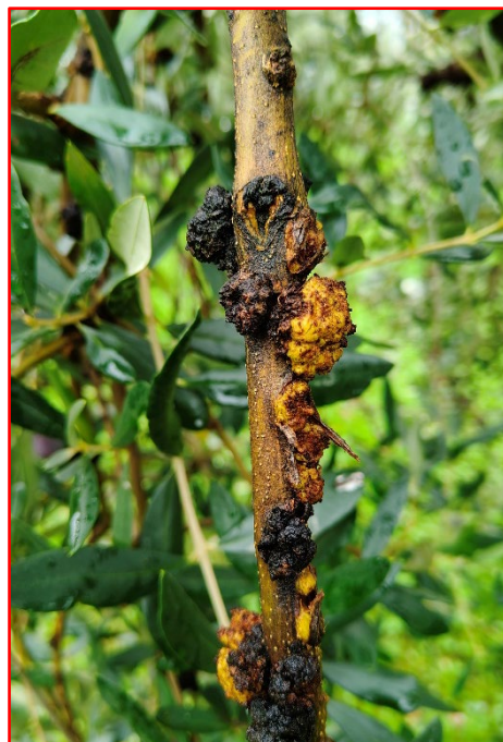
Nuovi tubercoli di Rogna in ingrossamento- areale Garda