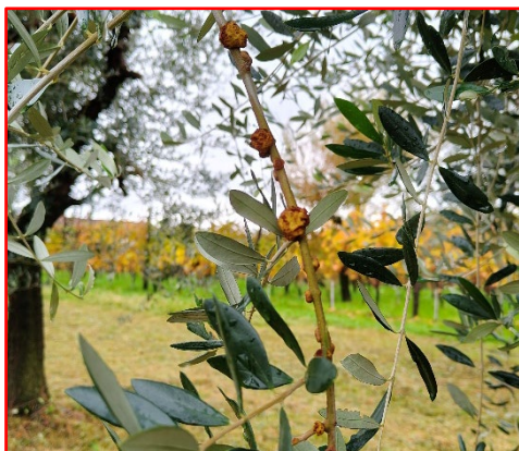
Nuovi tubercoli di Rogna in ingrossamento- areale Garda